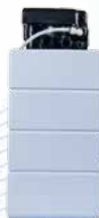
Retro / Back