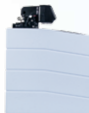
Lato / Side